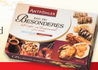
Premium Confekt- und Gebäckmischungen