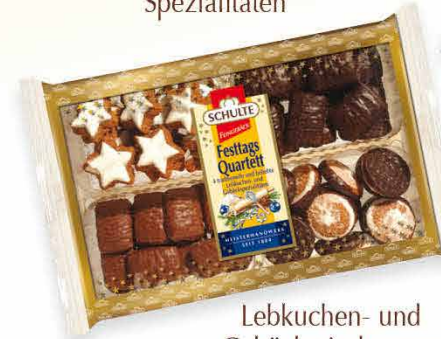
Lebkuchen- und Gebäckmischungen