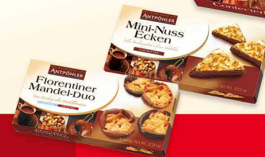
... in vielen Variationen